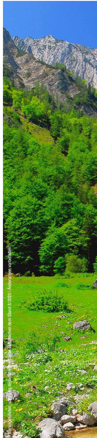
Die abgebildeten, ständig regelechten und zu sein festzulegen dem Stand 8/2020 | Änderungen vorbehalten!